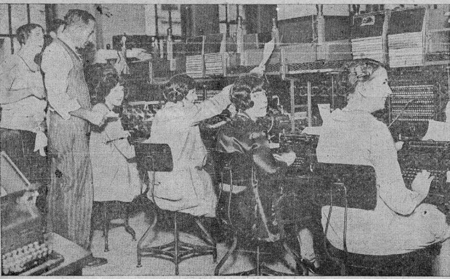
La foto muestra la central del servicio telefónico trasatlántico, que ha tenido trabajo excepcional con motivo de las fluctuaciones en la bolsa neoyorquina