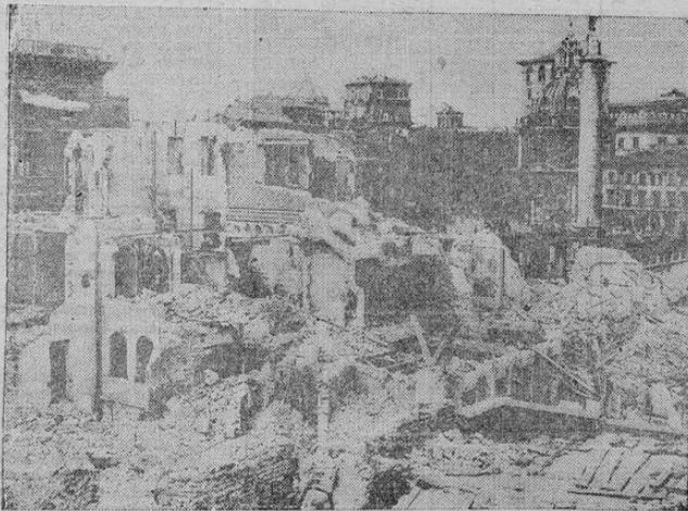
Gran número de trabajadores se ocupan de eribar las casas modernas de la Via Alessandrina, en Rima, para restaurar en lo posible el foro de Trajano y las termas de Paulo Emilio