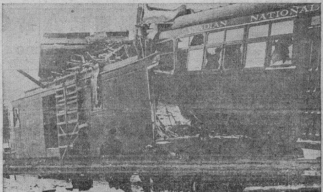
Un carro eléctrico chocó con una máquina limpia-nieve en una línea canadiense, entre Guelph y Toronto resultando tres heceros heridos.